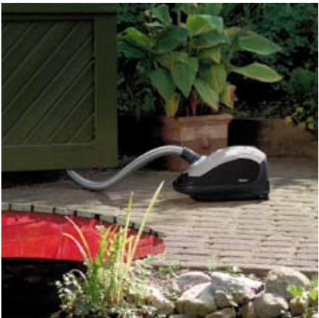
Nettoyer par exemple votre abri de jardin, où les prises de courant sont plutôt rares