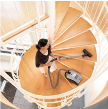
Disposer, dans certaines circonstances, d'une plus grande liberté de mouvement