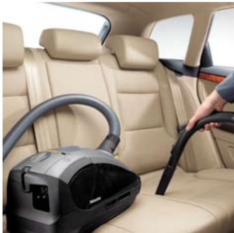
Nettoyer rapidement l'intérieur de votre voiture