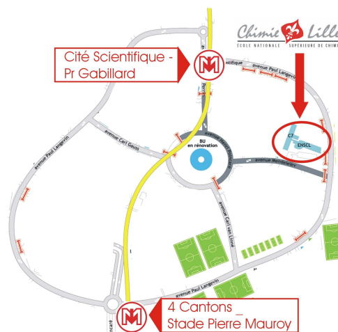
Université Lille 1 - Plan du campus

Catherine Renard, tel : 03 20 43 44 34 email : catherine.renard@ensc-lille.fr