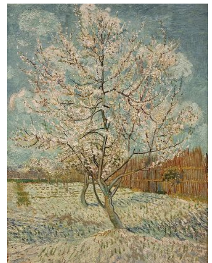
Verger de Van Gogh

Source : Compter le monde de Nouchka Cauwet