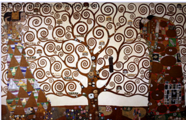
Arbre de vie de Gustave Klimt

Source : http://www.vangoghaventure.com/francais/chrono/vergers.html