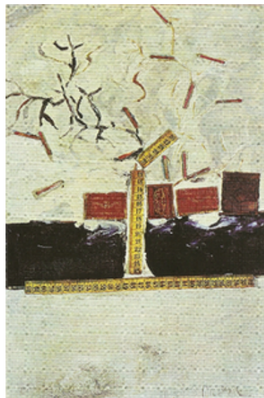
Centimètres de Francis Picabia, 1918

Source : Compter le monde de Nouchka Cauwet