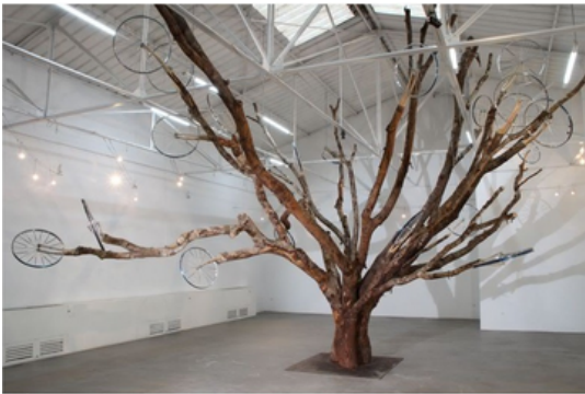
Unrooted trees de Benoît Mangin et Marion Laval-Jeantet