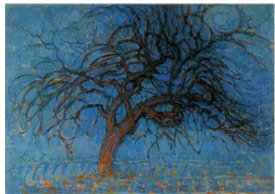
L'arbre rouge de Mondrian