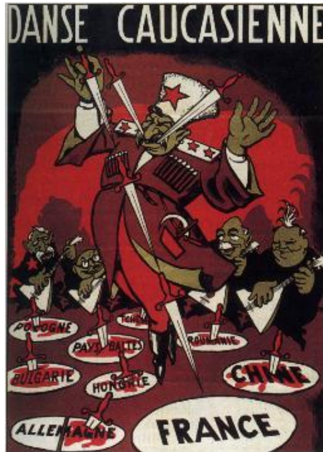
Affiche du mouvement Paix et Liberté de 1951