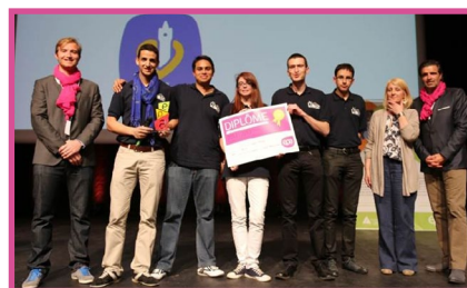
1 er catégorie +18 ans JOCKLIN - Université de Valenciennes et du Hainaut Cambrais