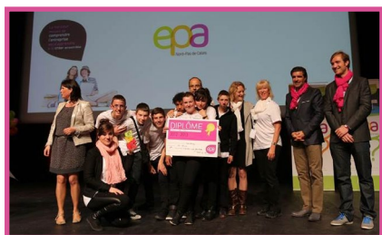
1 er catégorie 13-15 ans KIDFLASH - Lycée professionnel Vertes feuilles à Saint-André

La mini-entreprise « KidFlash » animée par des élèves de 3 ème prépa pro du lycée Vertes Feuilles, a gagné le 1 er prix collège avec son idée ; le « Wellstrap », une lanière qui soulage l'épaule lorsque les sacs sont trop lourds. Les gagnants de chaque catégorie, représenteront l'académie au concours national qui aura lieu les 5 et 6 Juillet au Parc de La Villette à Paris. Bonne chance à eux !