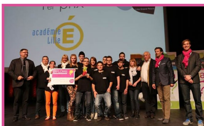
1 er catégorie 15-18 ans SMOOTH - EPIL de Lille