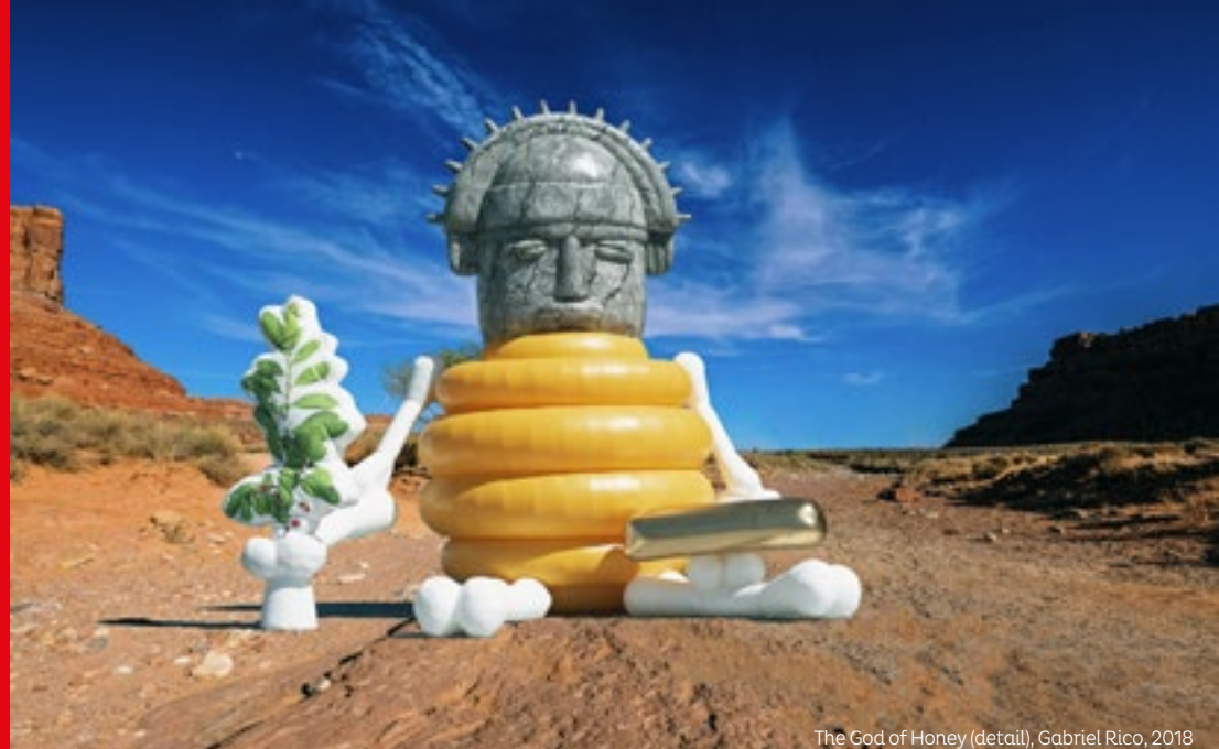
The God of Honey (detail), Gabriel Rico, 2018