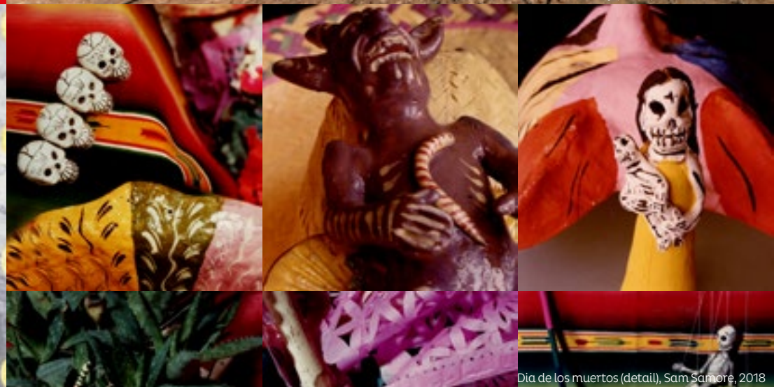
Día de los muertos (detail), Sam Samore, 2018