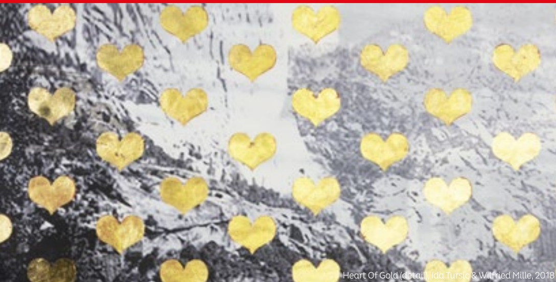
Heart Of Gold (detail), Ida Tursic & Wilfried Mille, 2018