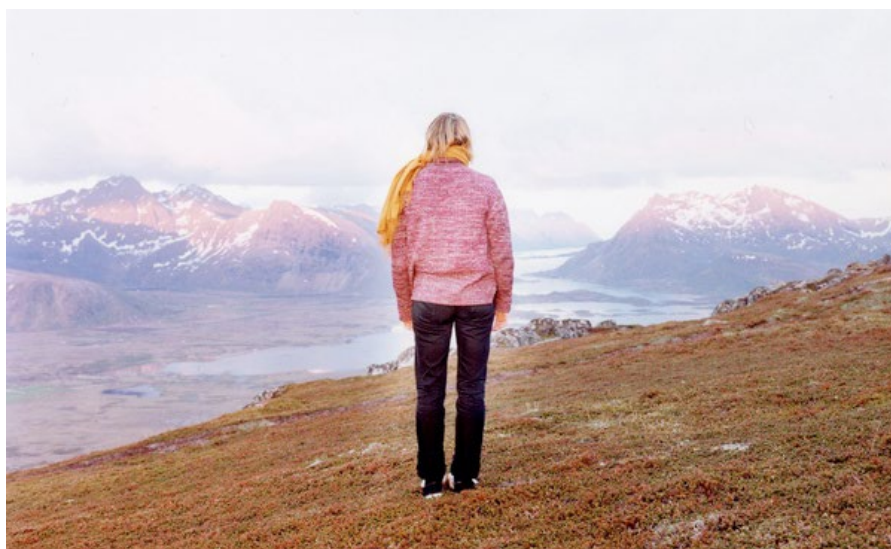
Elina BROTHERUS, Der Wanderer 4 , 2004 Photographie couleur chromogénique, 105x119 cm

Seconde exposition du Frac Nord-Pas de Calais depuis son ouverture, NOUVELLE GÉNÉRATION occupe l'espace du Forum (Niveau 4).