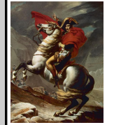
DAVID « Bonaparte franchissant les Alpes au col du grand St Bernard » 1802