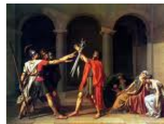
DAVID « le serment des Horaces » 1784

Première Encyclopédie conçue par Diderot et d'Alembert