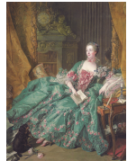
BOUCHER « La marquise de Pompadour » 1756

(1700 à 1800) = »style rocaille« surcharge, frivolité, légèreté