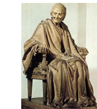
HOUDON « Voltaire assis » 1781

Apparition du crescendo et du decrescendo