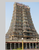
Temple de Meenakshi XVIII èe siècle