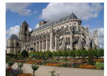
Cathédrale gothique de Bourges (1250)