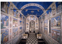
GIOTTO « fresques de la chapelle Scrovegni » à Padoue 1304-06