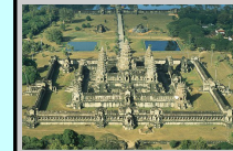
Temple d'AngkorVat 800 à 1200