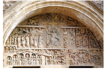
« Tympan du jugement dernier » abbatiale Sainte-Foy de Conques XII siècle