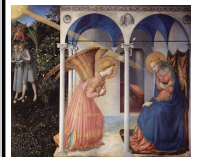
FRA ANGELICO « Annonciation » 1426

- ART DU VISUEL: la Tour de Pise, la tapisserie de Bayeux, La Sainte-Chapelle à Paris, la Cathédrale Notre- Dame à Paris, les cathédrales de Bourges, Chartres, Reims... Duccio, Fra Angelico, Van Eyck, Van der Weyden