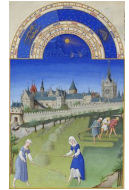
Les frères LIMBOURG « Les très riches heures du Duc de Berry » 1411