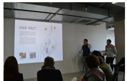
Restitution des projets des étudiants au FRAC NPDC, 3 février 2017