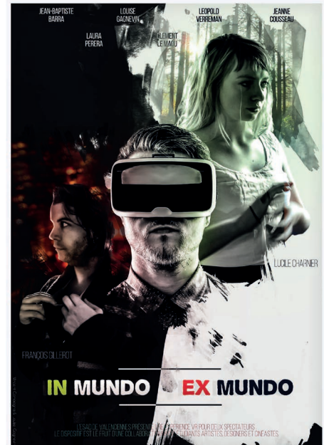
Affiche du film «In Mundo / Ex Mundo»

2. Nous serons présents au festival de création numérique de la Serre Numérique en juin prochain avec le projet 360 (réalité virtuelle) et les objets non standard.