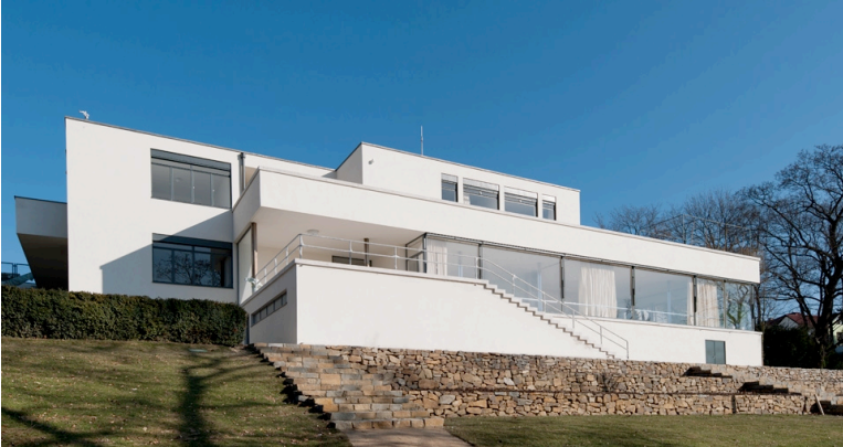
Mies Van der Rohe, Villa Tugendhat, Brno, République Tchèque, 1928-30