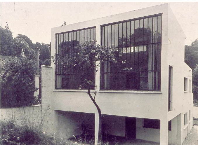
Van Doesburg,, atelier de Meudon, 1931