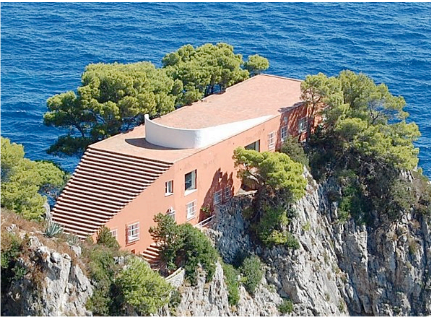
Adalberto Libera, Villa Malaparte, Capri, Italie, 1937