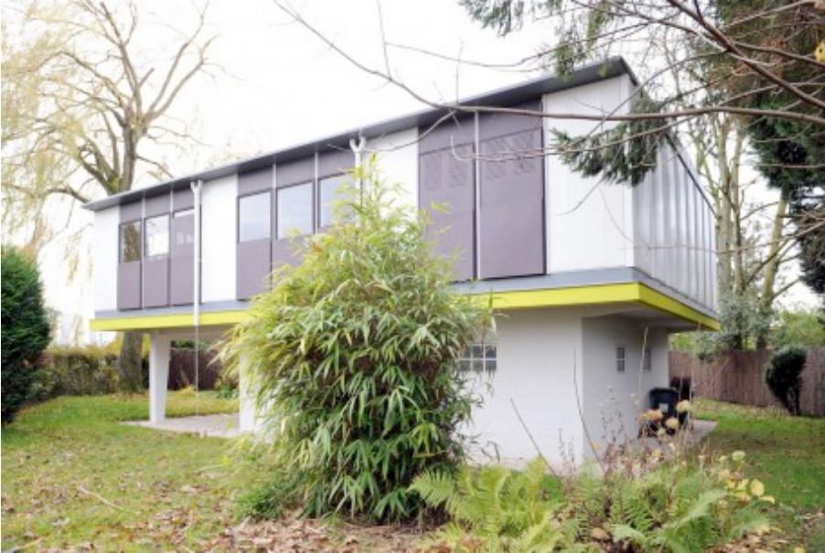
Jean Prouvé, Pavillon Prouvé, Tourcoing, 1953