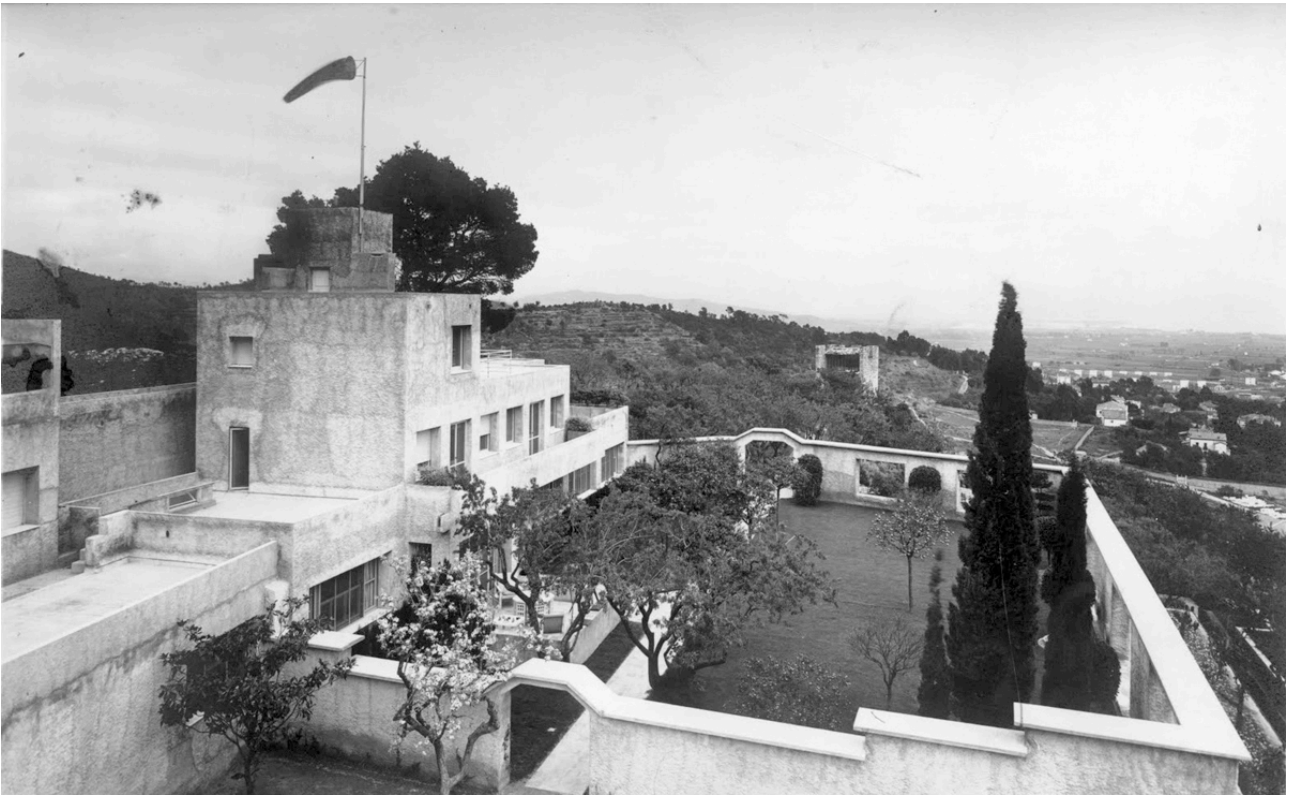
Robert Mallet-Stevens, villa Noailles, Hyères, 1923-33

Construite pour les Noailles (collectionneurs d'art) qui l'habitent dès 1925, la villa applique des principes de fonctionnalité : éléments décoratifs épurés, toits-terrasse, lumière, simplification des volumes... Des extensions vont se succéder jusqu'en 1933. Architecture-manifeste,