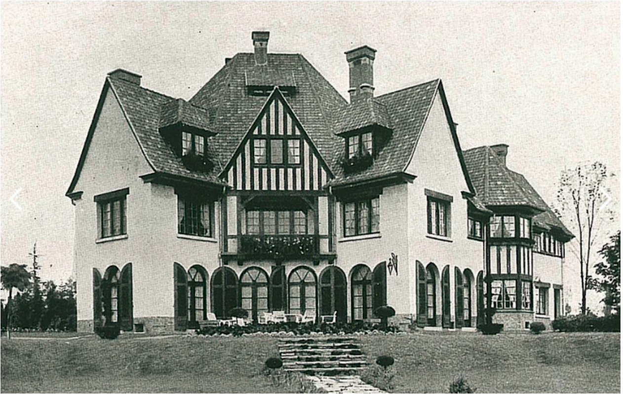
Charles Bourgeois, Villa Blancs pignons, colline de Beaumont, 1929 (détruite)