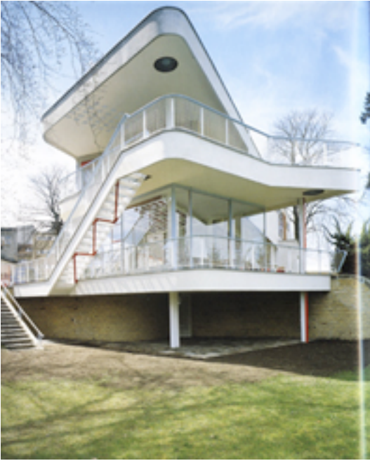
Maison Schminke, Sharoun, Löbau, Allemagne, 1933