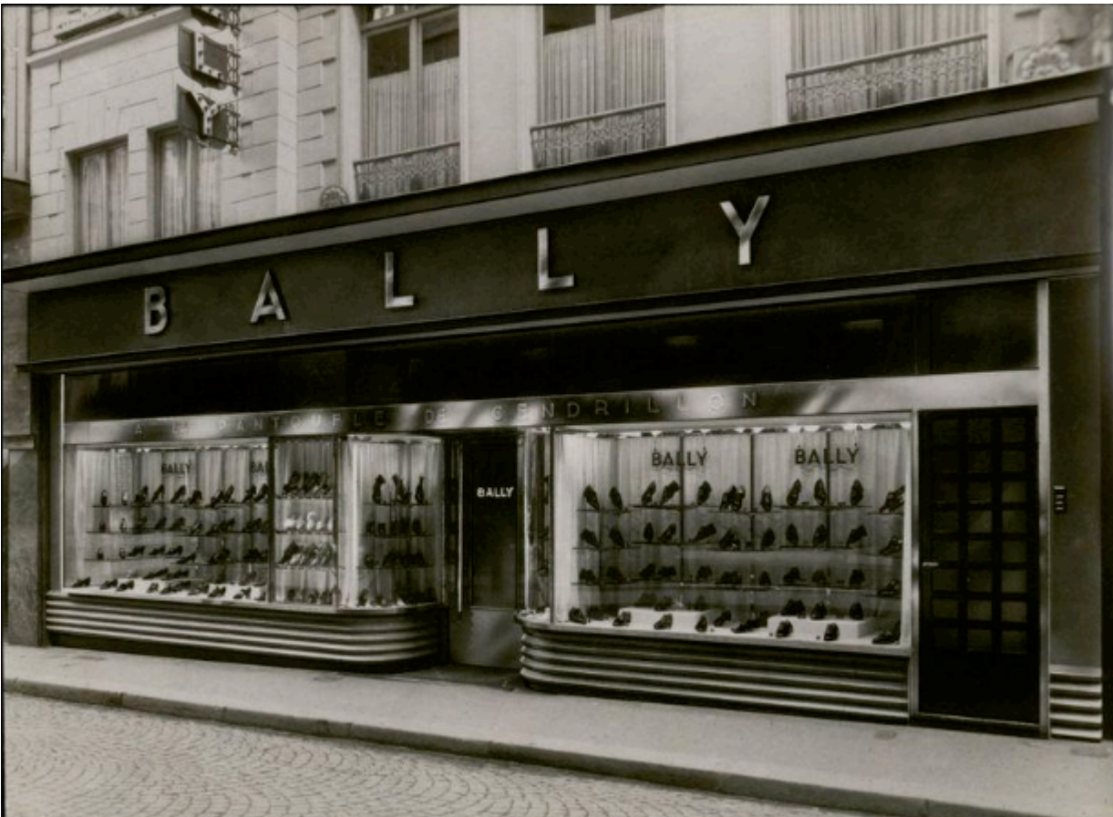
Robert Mallet-Stevens, Boutique Bally, Rouen, 1934