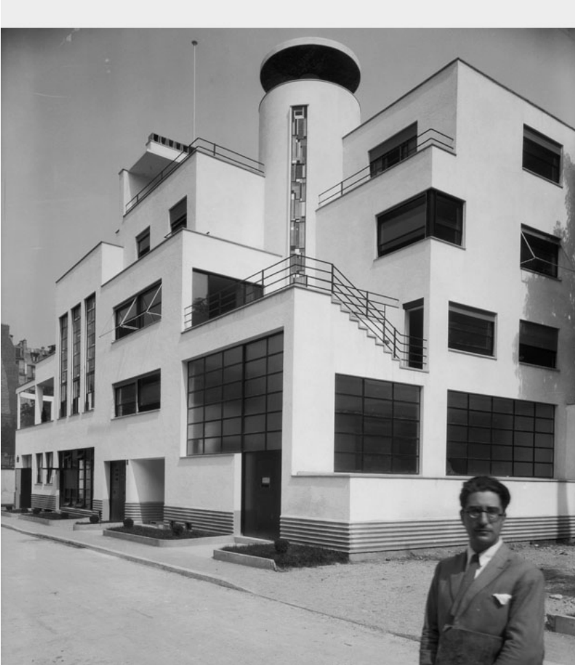
Robert Mallet-Stevens, rue Mallet-Stevens, Paris, 1926-27