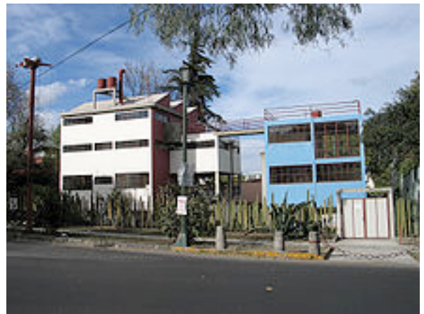
Maison de D Rivera et Frieda Kahlo, Juan O' Gorman, San Angel, Mexique, 1930-32