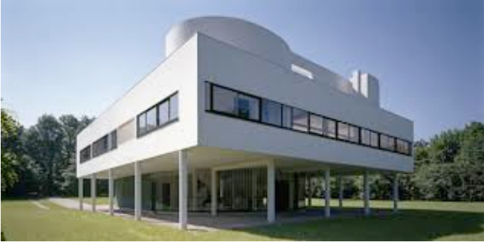
Le Corbusier, Villa Savoye, Poissy, 1929-30