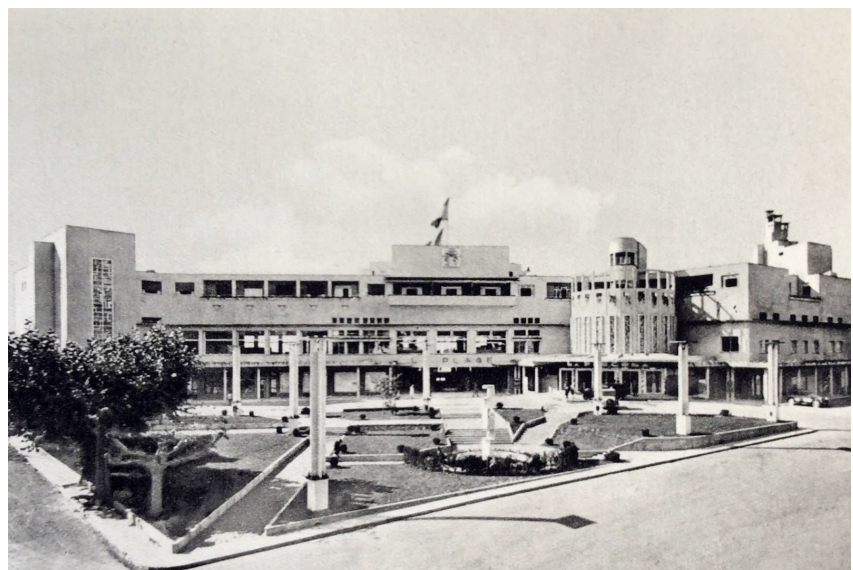
Robert Mallet-Stevens, Casino, Saint Jean de Luz, 1927