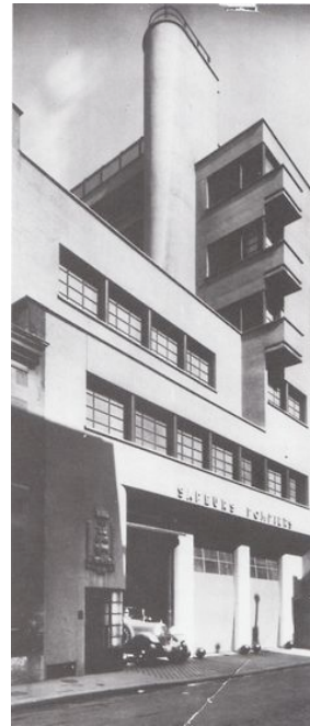
Robert Mallet-Stevens Caserne de pompiers rue Mesnil, Paris, 1935