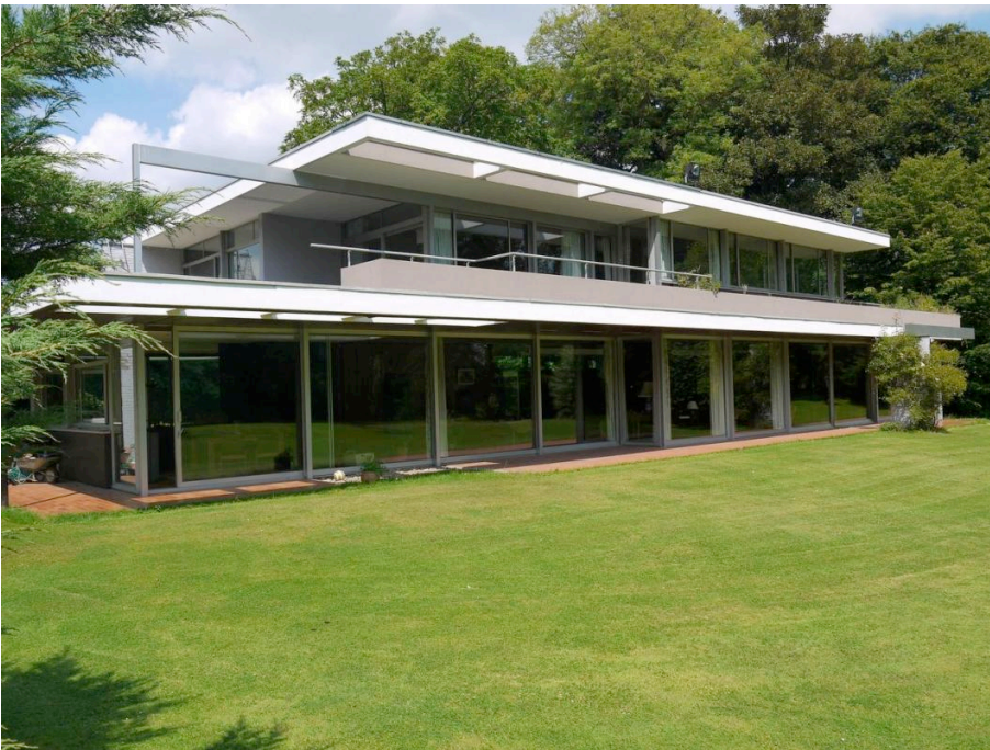
Richard Neutra, Maison Delcourt, Croix, 1968