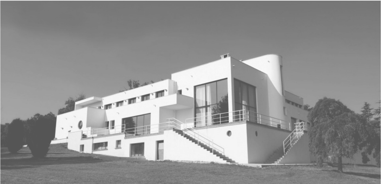
Robert Mallet-Stevens, Villa Paul Poiret à Mezzy, 1921-23