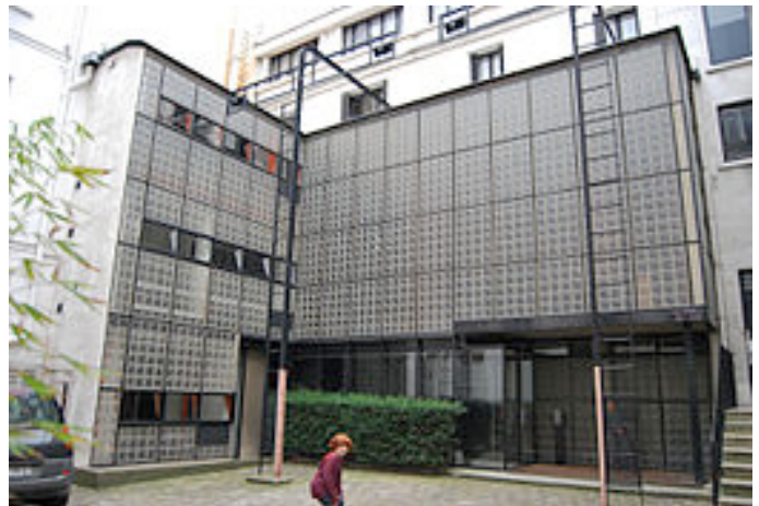
Pierre Charreau, Maison de verre, Paris 1928-31