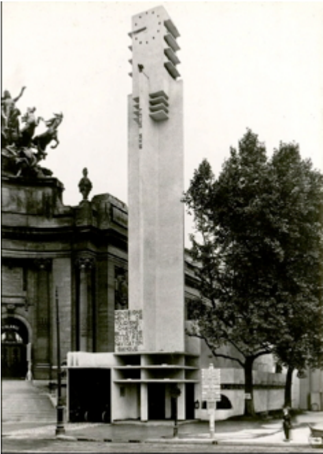
Robert Mallet-Stevens, pavillon du tourisme, Paris, 1925