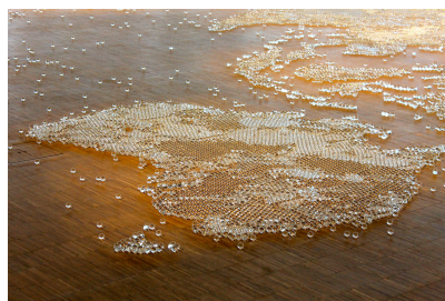
Mona HATOUM, Map clear , 2014, carte du monde représentée en billes de verre.