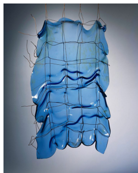
Mary Shaffer, Hanging series blue , 1982.