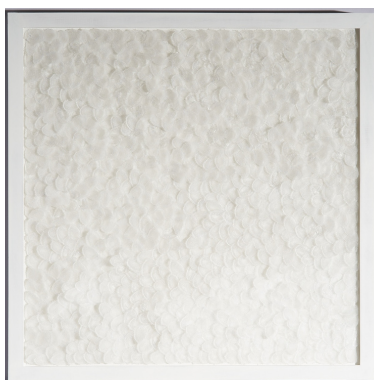
Sylvie Vandenhoucke, Verdures , 2010.