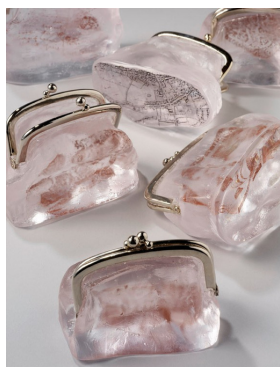
Philippa Beveridge, Lost and found , 2009.