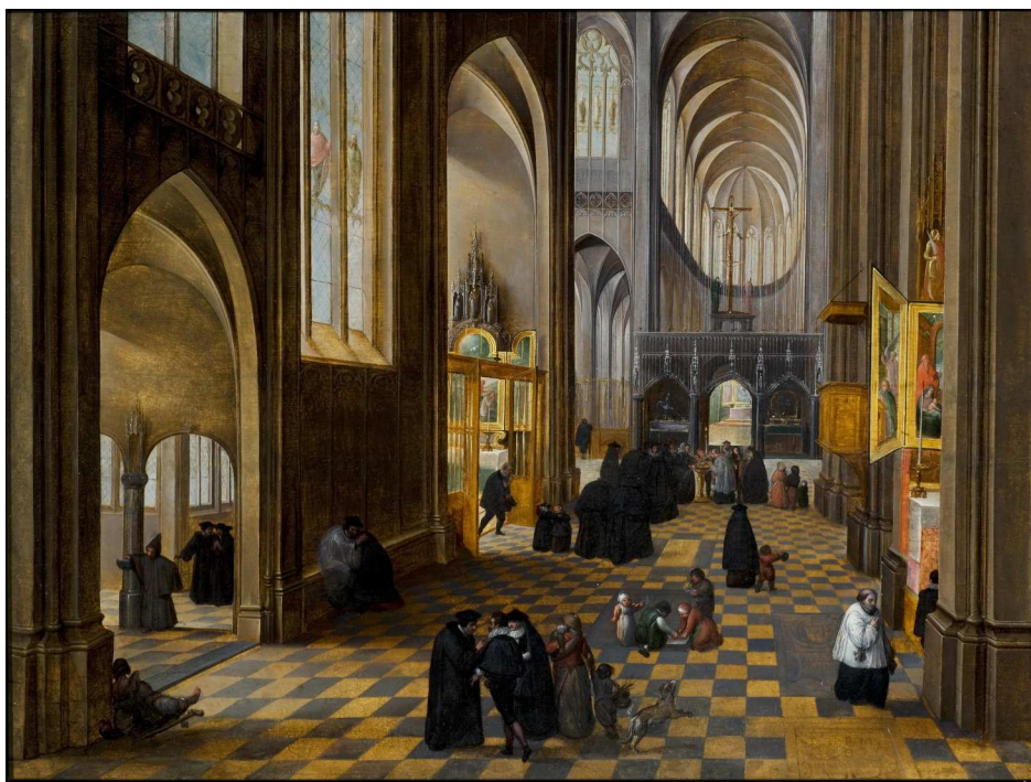
Abel GRIMMER, Baptême dans la nef d'une église , huile sur bois