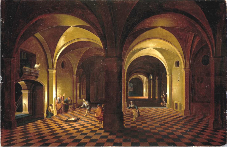
Hendrijk VAN STEENWIJK LE JEUNE, Le Sermon de saint Pierre à ses geôliers , huile sur bois