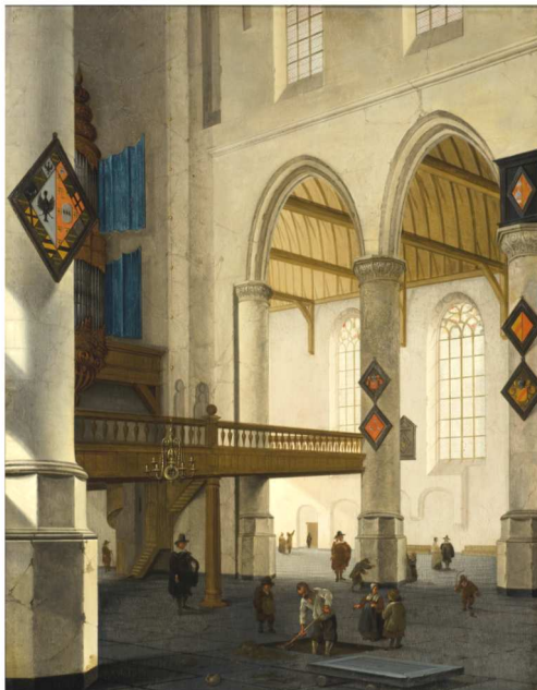
Cornelis DE MAN, L'Orgue de la vieille église de Delft, huile sur