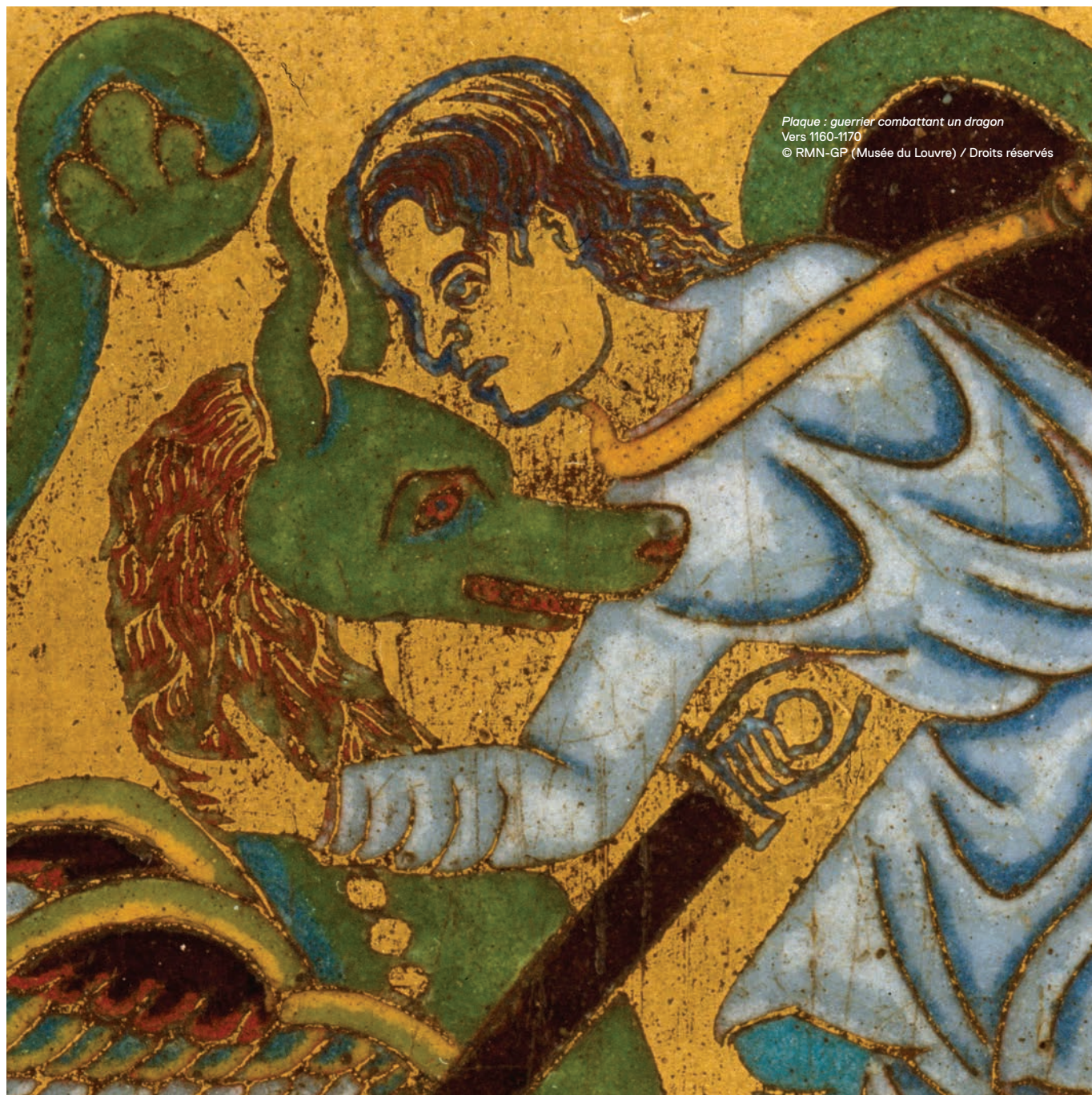
Plaque : guerrier combattant un dragon Vers 1160-1170