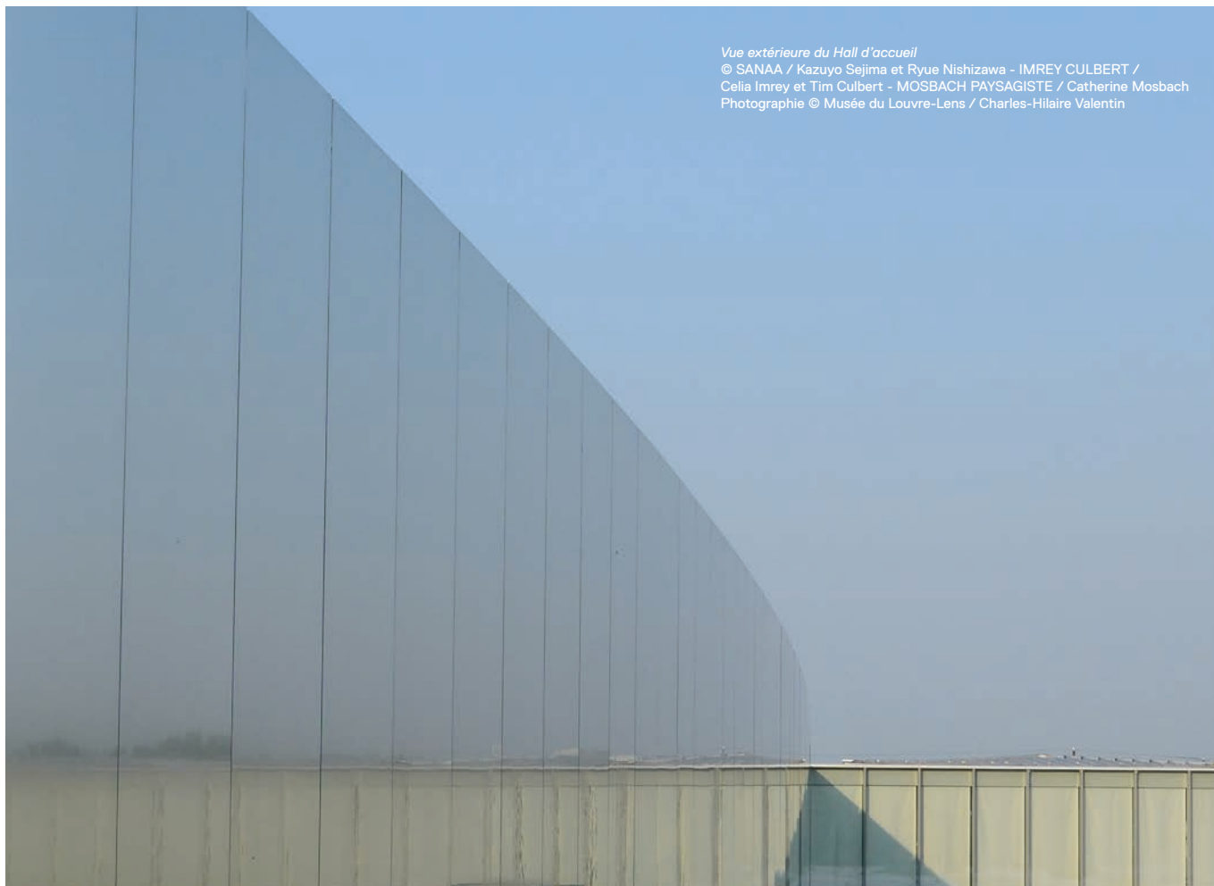
Vue extérieure du Hall d'accueil © SANAA / Kazuyo Sejima et Ryue Nishizawa - IMREY CULBERT / Celia Imrey et Tim Culbert - MOSBACH PAYSAGISTE / Catherine Mosbach

Comment résumer une œuvre ? Le cartel, support textuel d'informations sur l'œuvre, source première de renseignements pour le visiteur du musée, répond à une formulation normée. Aux participants d'en explorer les rouages pour mieux les détourner. À l'aide d'outils informatiques d'édition et de graphisme, ils proposent une version innovante et décalée des cartels d'œuvres accrochées au musée du Louvre-Lens