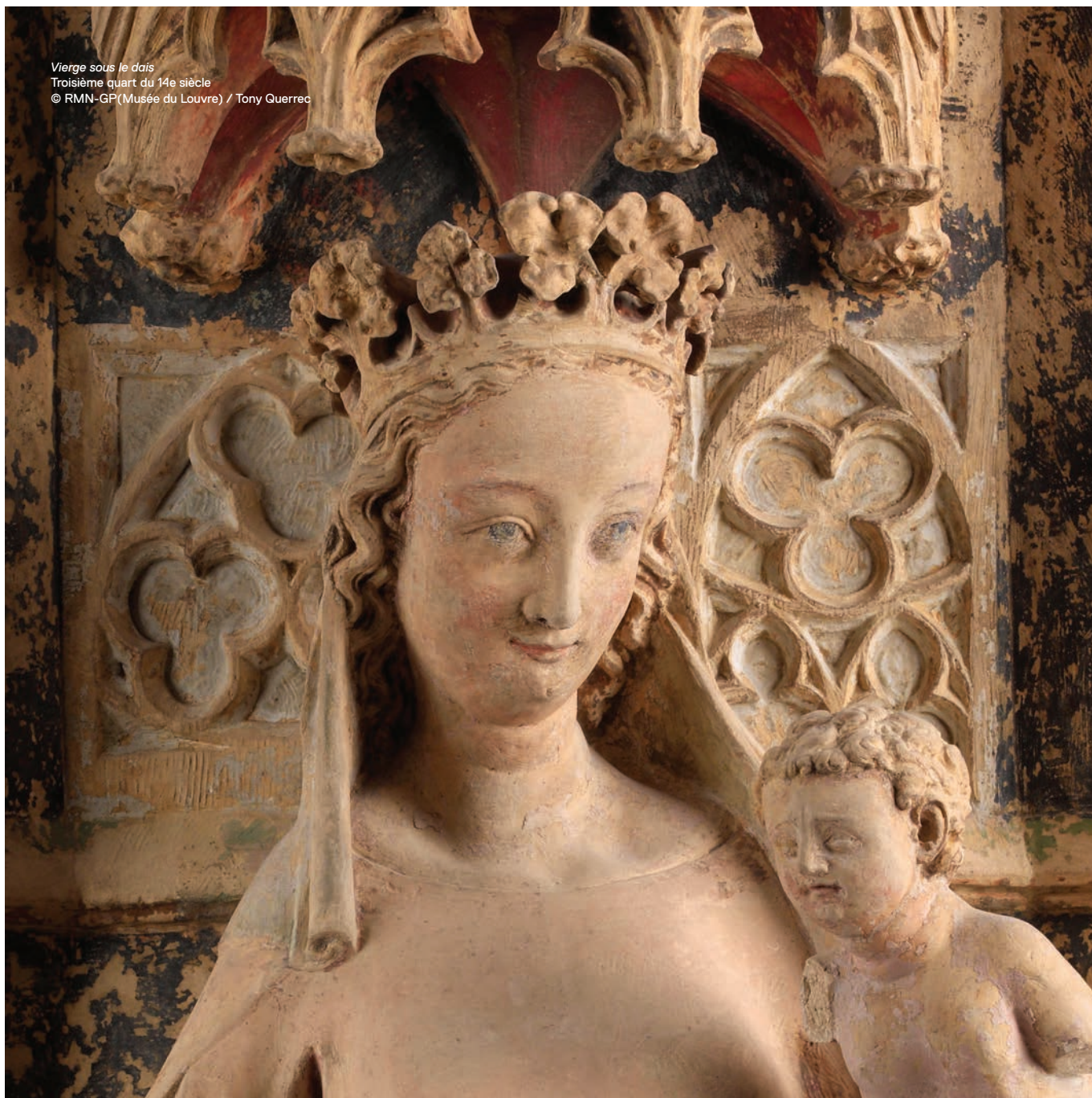
Vierge sous le dais Troisième quart du 14 e siècle