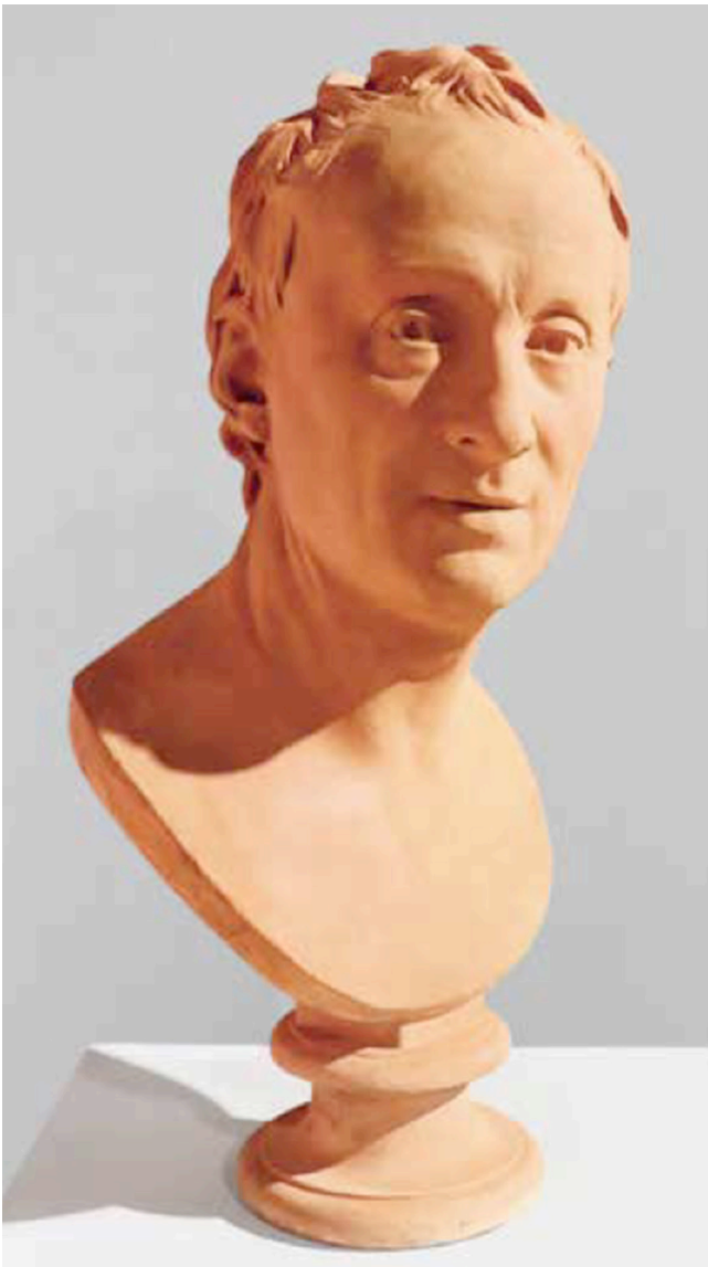
D'après Jean Antoine Houdon (Versailles, 1741 – Paris, 1828) Buste de Denis Diderot 1780, plâtre patiné façon terre cuite H. 58; L. 28; Pr. 28 cm Langres, musées de Langres