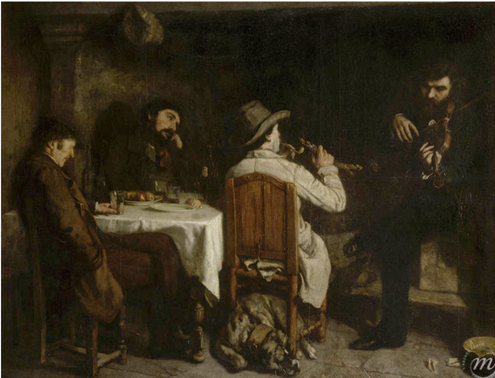
Gustave Courbet (1849) L'Après-dîner à Ornans