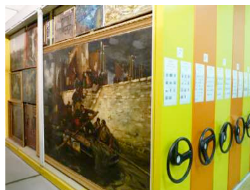
Vue des réserves au MBA

Découverte ensuite des salles d'expositions.