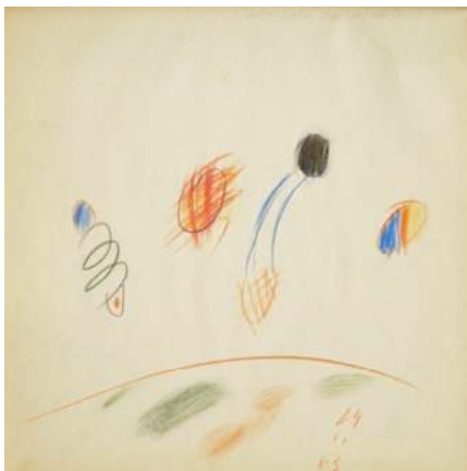
Bernard Rancillac, L'ombre portée des satellites , Carnet de dessins n°5, 1963. Collection LAAC, Dunkerque © ADAGP, Paris 2011

Les carnets de Bernard Rancillac constituent une sorte de journal lié au quotidien, des sortes de remarques dessinées de ce qu'il fait, de ce qu'il voit et de ce qu'il pense. En 1963, alors que se forme autour de Mathias Fels le premier noyau de la Figuration Narrative qui aboutira à l'exposition « les mythologies quotidiennes » de 1964, Bernard Rancillac délaisse ses œuvres informelles qu'il réalisait jusqu'alors pour renouer avec une figuration héritée de Cobra, libre et en dehors de toute convention. Croqués rapidement aux crayons de couleur, les planches semblent jaillir spontanément. Les objets et motifs sont parfois à peine reconnaissables tant le dessin est incisif et rapide. Ce style personnel que Bernard Rancillac met en place cette année là est caractérisé par une grande franchise, presque une verve, et un trait humoristique qui le mènera bientôt à la bande dessinée.