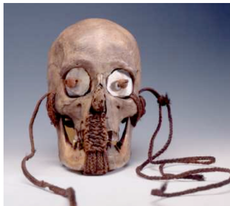
Iles Marquise, Crâne Trophée , Crâne humain . Collection musée des Beaux-Arts, Dunkerque