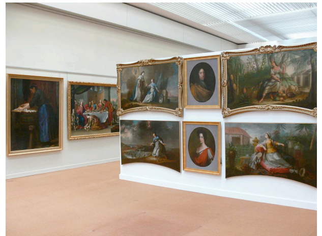
Vue de la réserve visitable, 1 er étage du Musée des Beaux-Arts