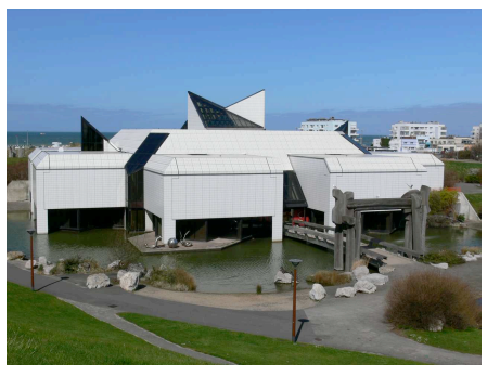
LAAC Lieu d'Art et Action Contemporaine Jardin de sculptures 59140 Dunkerque

Samedi 3 décembre et dimanche 4 décembre 2011, rencontre sous forme de workshop avec l'artiste Philippe Richard, toute la journée, sur réservation au 03.28.66.99.48