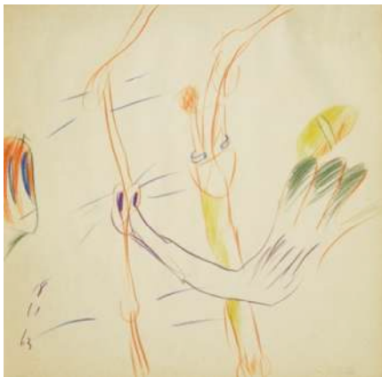
Bernard Rancillac, La pilule , Carnet de dessins n°5, 1963. Collection LAAC, Dunkerque © ADAGP, Paris 2011