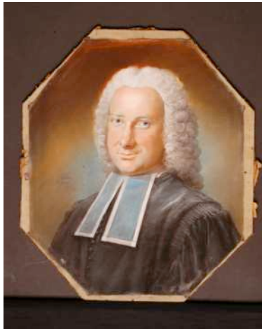
Léon Glain, Portrait de Nicolas Bernard Pierre Taverne , avocat en parlement, 1751, pastel sur papier. Collection musée des Beaux-Arts, Dunkerque

Le musée des Beaux-Arts de Dunkerque renouvelle, à l'occasion des journées du patrimoine, ses expériences inédites de travail et d'accrochages menées en collaboration avec le Musoir, Société des Amis des musées de Dunkerque.