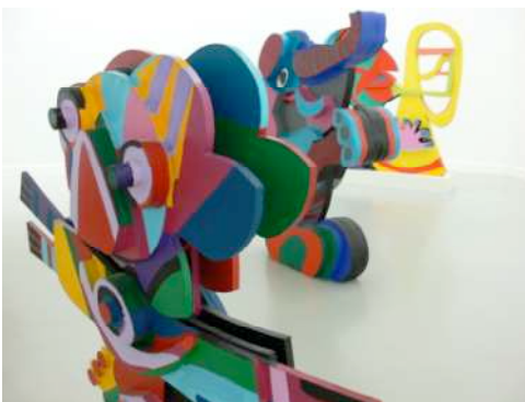
Karel Appel, Circus , acrylique sur contreplaqué, dimensions variables. Collection LAAC, Dunkerque

Karel Appel est surtout connu pour sa peinture, mais ses expériences dans la sculpture l'ont continuellement accompagnées.