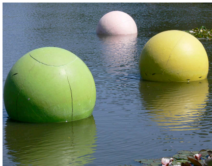
Charlotte Moth , sculpture for the laac , 2005. Collection LAAC, Dunkerque.

Fiches pédagogiques pour une visite autonome, disponibles pour les enseignants de collèges.