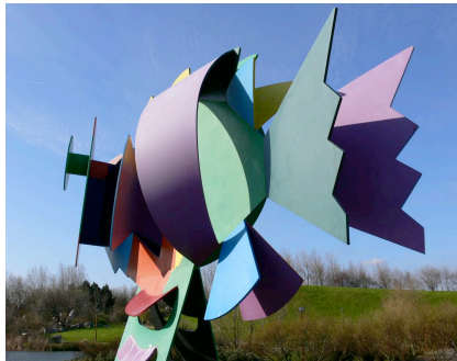
Karel Appel , Poisson , 1982 . Collection LAAC, Dunkerque.

Lieu d'Art et Action Contemporaine, Dunkerque