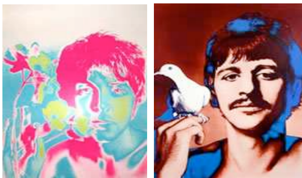
Richard Avedon, Les Beatles , 1967. Sérigraphie des Beatles. Galerie Janos, Paris © Richard Avedon