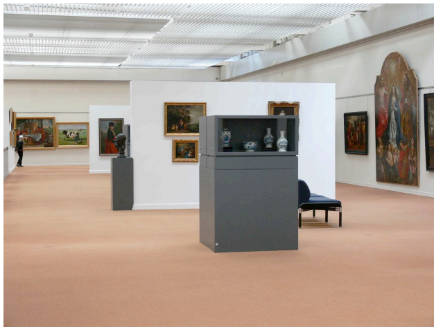
Vue de la réserve visitable, 1 er étage du Musée des Beaux-Arts

Le premier étage du musée des Beaux-Arts de Dunkerque offrait un vaste espace d'exposition qui permettait au public de découvrir les peintures, sculptures et céramiques de la collection. Transformé depuis cette année en « réserve visitable », cet espace s'est vu complété d'un nombre important de pièces : près de 500 œuvres et objets ont ainsi été sortis des réserves. Ils côtoient à la manière d'une réserve, autrement dit sans véritable « classement scientifique », les anciennes collections permanentes et laissent deviner l'ampleur et la diversité des collections conservées. Destinée à la réflexion, la recherche et l'étude des collections, cette « réserve visitable » est dotée de fiches documentaires reprenant les principales informations conservées sur les œuvres.