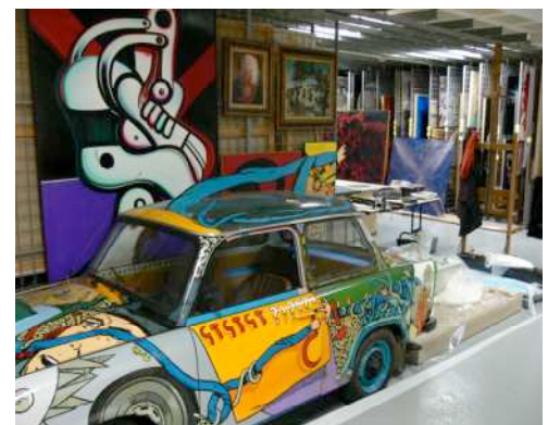
Vue des réserves au LAAC