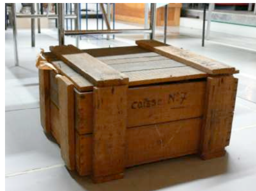
Caisse de conservation pour objets.