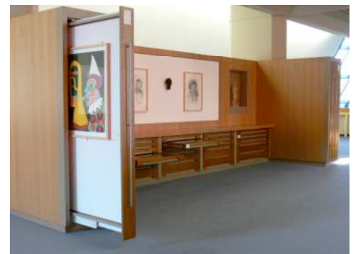
Cabinet d'arts graphiques