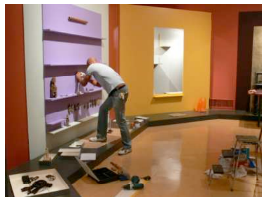
Préparation d'un espace d'exposition