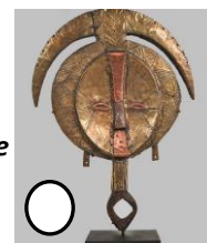
Reliquaire Kota Gabon

Le reliquaire n'est pas une pratique liée à la seule religion chrétienne comme le prouvent les reliquaires bouddhiques (Birmanie, Tibet, Japon ...), islamiques (Turquie) ou encore africains dans le cadre du culte des ancêtres.