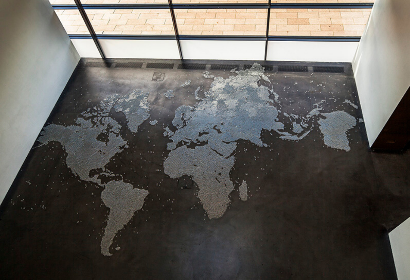
Map Clear, 2015 Mona Hatoum,

Née à Beyrouth au Liban en 1952, Mona Hatoum réalise ici une carte du monde faite de billes de verre limpides comme du cristal, de 20 mm de diamètre. Les billes ne sont pas fixées au sol, de sorte que la carte est instable et vulnérable puisque les vibrations des mouvements des visiteurs peuvent en faire bouger des parties, voire la détruire.