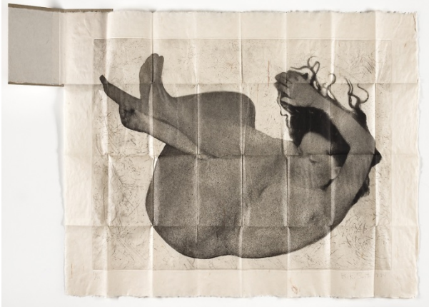
Kiki Smith, Free Fall , Livre d'artiste, 1994.

Né pendant le mouvement Surréaliste au courant des années 1920