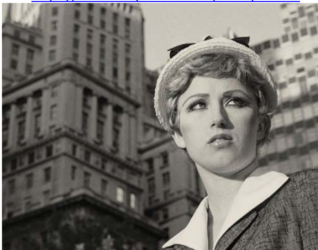
Cindy Sherman, Still from an Untitled film , 1978.