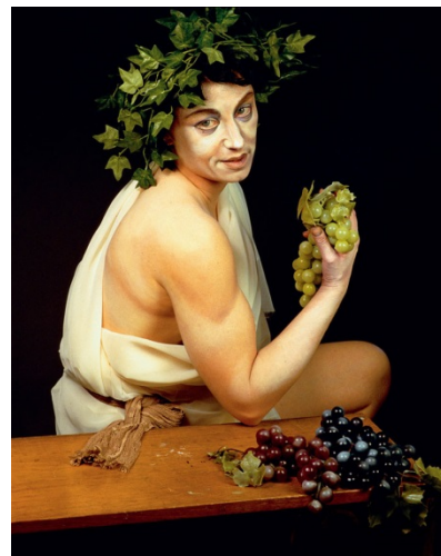
Cindy Sherman, Untitled #224 , D'après Bacchus