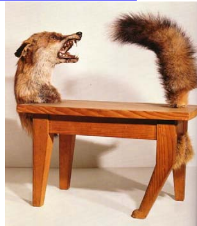
Victor Brauner, (1902-1966) Loup-table , 1939-1947 Bois et éléments de renard naturalisé 54 x 57 x 28,50 cm – Mouvement Dada

http://www.lecoindesartsplastiques.com/2019/11/kiki-smith-au-travail.html