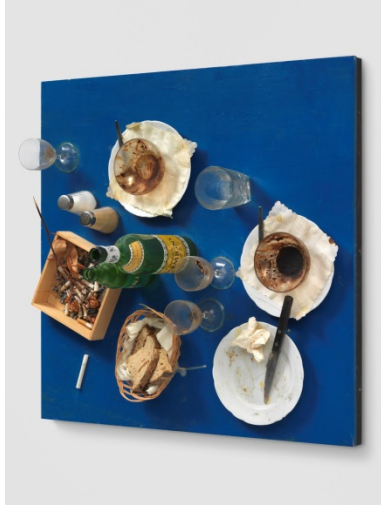
Daniel Spoerri, Tableau piège , 1960.