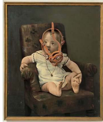
Daniel Spoerri, Attention chien méchant , Détrompe-l'oeil 1962 NB : le tableau n'est pas peint par l'artiste, il a été trouvé en brocante.