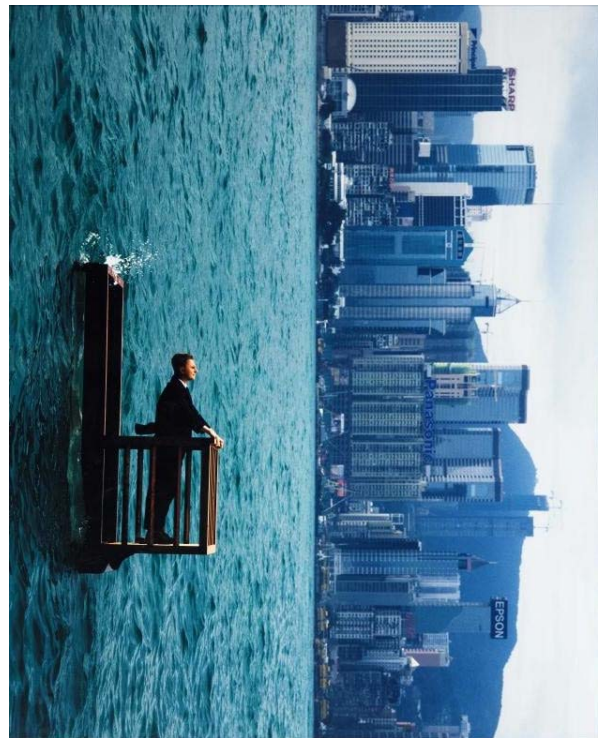
Philippe Ramette, Balcon II Hong Kong , 2001