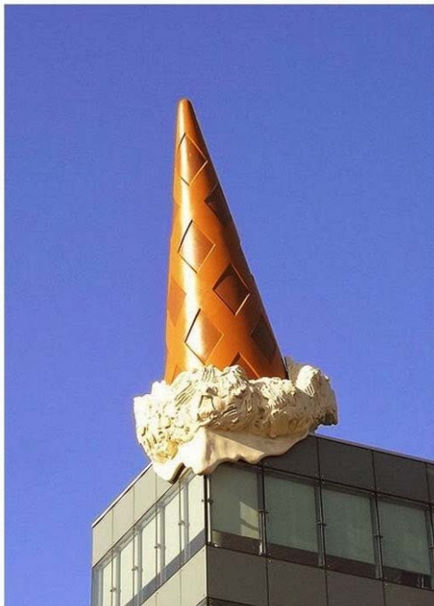
OLDENBURG Claes (né en 1929) & VAN BRUGGEN Coosje (1942-2009), The Dropped Ice cream cone , 2001