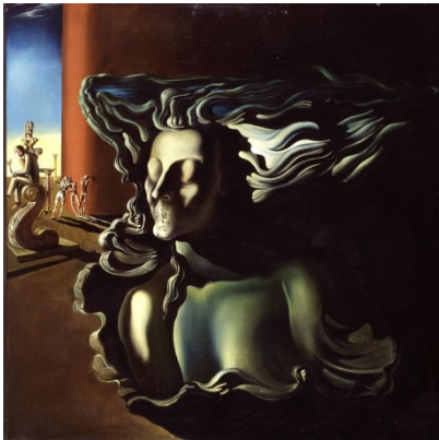
Salvador Dalí, Le rêve , 1931